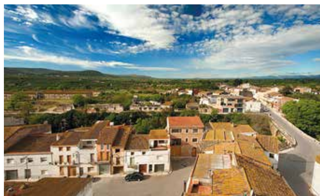
TARRAGONA-La Galera. Gentilicio: Galerino/a; población: 770.