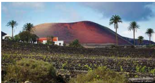
LAS PALMAS-Tias. Gentilicio: Tiense; población: 20.019.