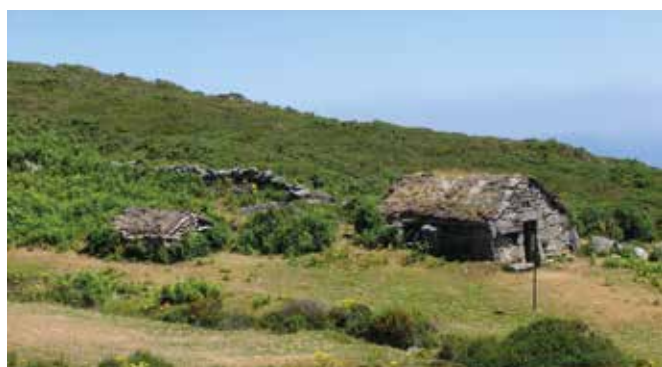
OURENSE-Avion. Gentilicio: Avioneses; población: 1.962.