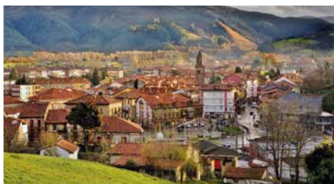
CANTABRIA-Cabezón de la Sal. Gentilicio: Cabezónense; población: 8.353.