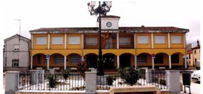
ZAMORA-Cubo del Vino. Gentilicio: Cubino/a; población: 355.