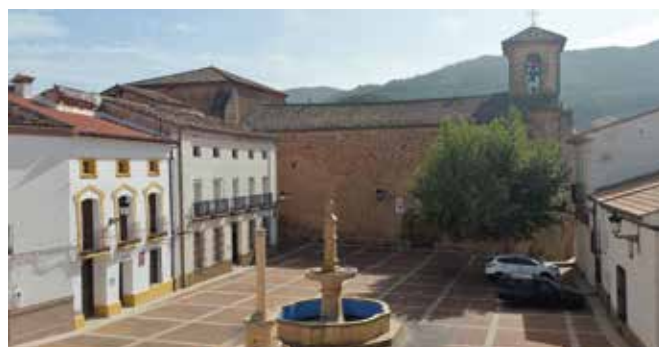
ALBACETE, Bienservida. Gentilicio: Bienservidos/as; población: 664.