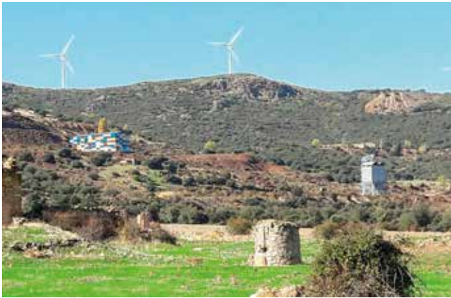
TERUEL-Ojos Negros. Gentilicio: Ojonegrino/a; población: 169.