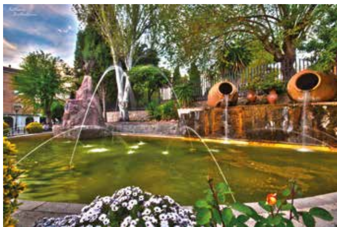
GRANADA-Peligros. Gentilicio: Peligreño/a; población: 11.154