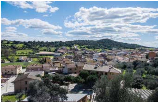
TOLEDO-Pepino. Gentilicio: Pepino/a; población: 2.714.