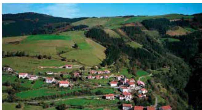
GUIPUZCOA-Orea. Gentilicio: Oreaarra; población: 126