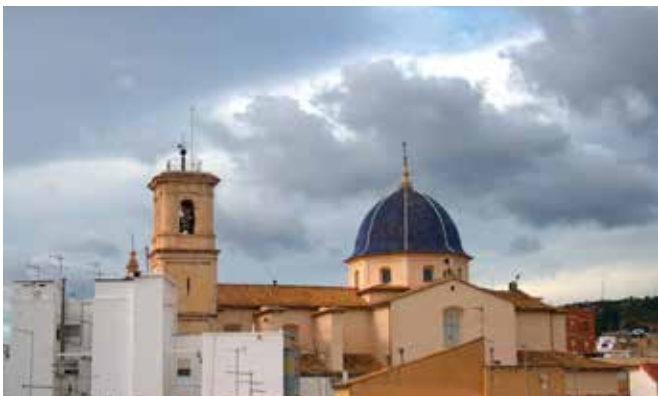
VALENCIA-Chiva. Gentilicio: Chivano/a; población: 15.004