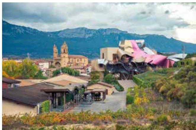
ÁLAVA, ElCiego. Gentilicio: Elcieguense; población: 1.051