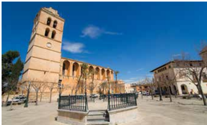
ILLES BALEARS-Muro. Gentilicio: Murero/a; población: 6.723.