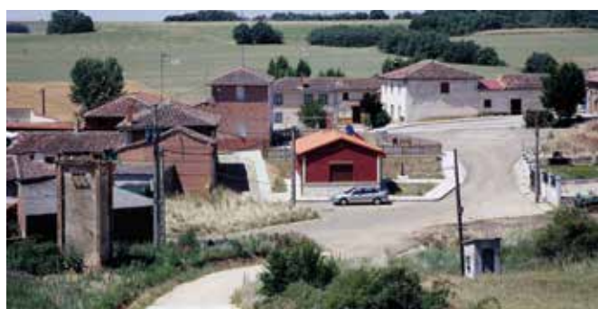
PALENCIA-Lagartos. Gentilicio: Lacertanos/as; población: 137.