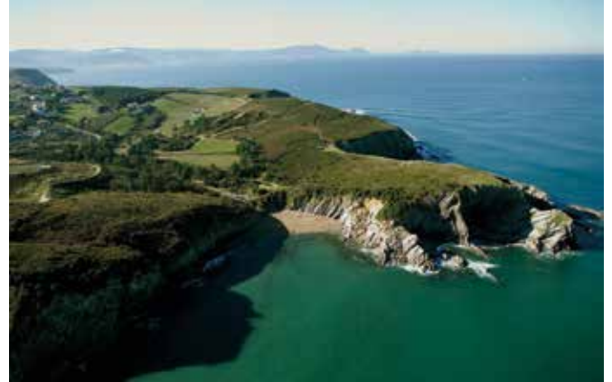
VIZCAYA-Barrika. Gentilicio: Barrikoztarra; población: 1.539.