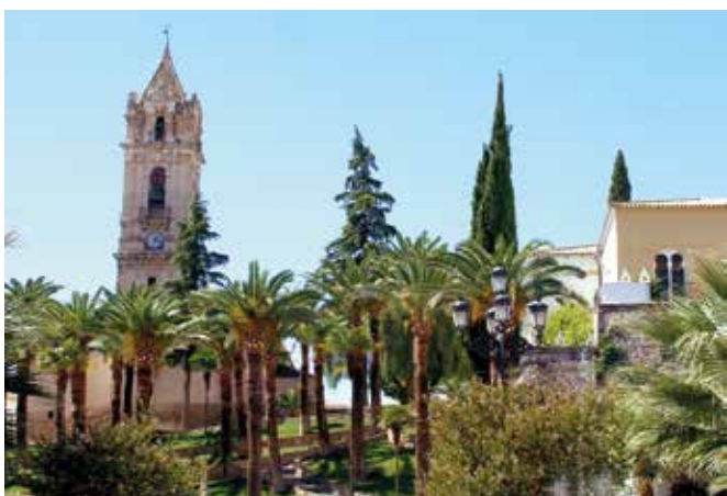
CORDOBA-Cabra. Gentilicio: Egabrense; población: 20.837.