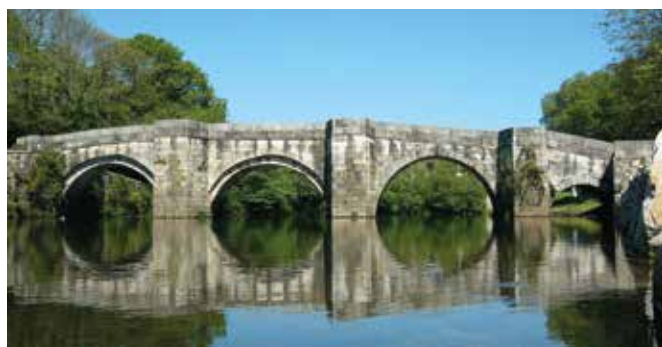
A CORUÑA, Zas. Gentilicio: zense; población: 4.846.