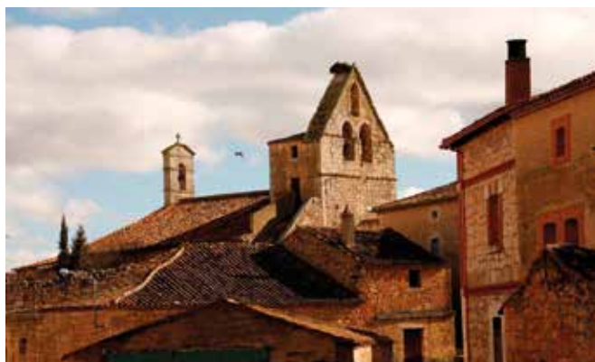
BURGOS-Iglesiarubia. Gentilicio: Iglesterrubino/a; población: 44.