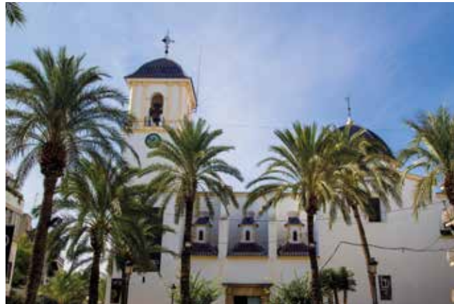
ALICANTE, Dolores. Gentilicio: Majaeros/as; población: 7.246.