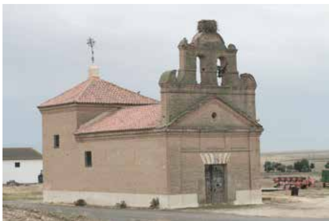
ÁVILA, Cabezas de Alambre. Población: 168.