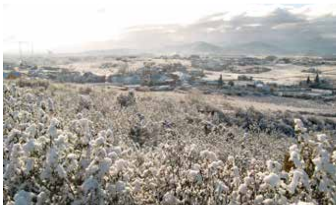
LEON-Cabañas Raras. Gentilicio: Cabañeses; población: 1.337