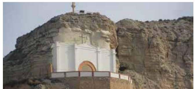
ZARAGOZA-Remolinos. Gentilicio: Remolinero/a; población: 1.143.