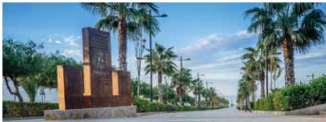
ALMERÍA, Balanegra. Gentilicio: Balanegrense; población: 2.835.