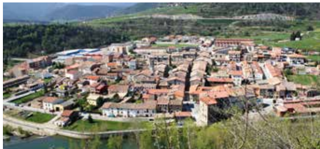
BARCELONA-Montesquiu. Gentilicio: Montesquivains; población: 943.