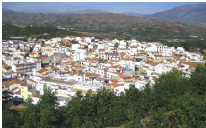
MALAGA-Benamocarra. Gentilicio: Benamocarreños/as; población: 3.047