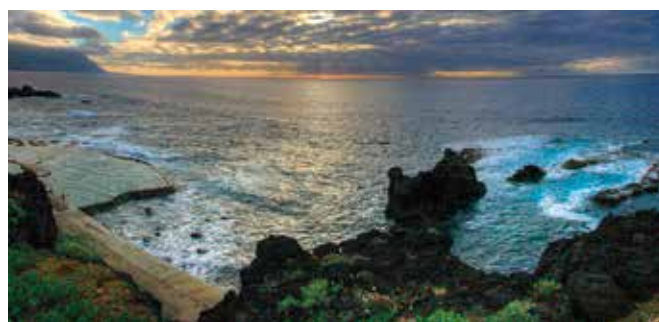
SANTA CRUZ DE TENERIFE-La Frontera. Gentilicio: Legañoso/a; población: 3.926.